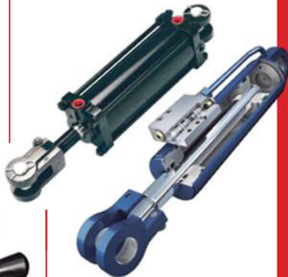
Fabricación y reparación de cilindros hidráulicos