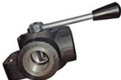
Desviador de caudal