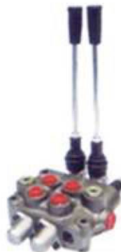
Distribuidor hidráulico (2 palancas)