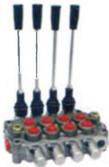
Distribuidor hidráulico (4 palancas)