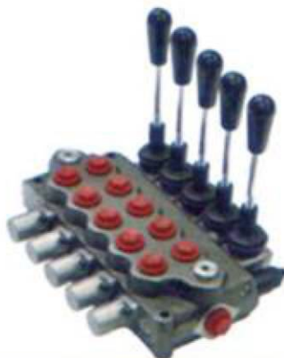
Distribuidor hidráulico (5 palancas)