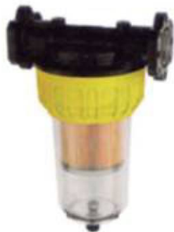
Filtro clean captor