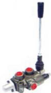
Distribuidor hidráulico (1 palanca)