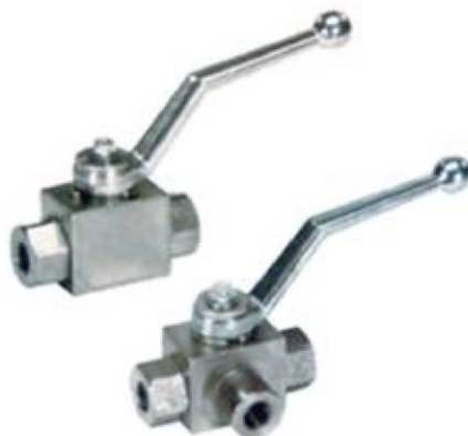
Desviador esfera 2 y 3 vías