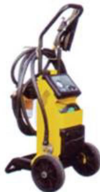
Purificador para diesel y aceite hidráulico