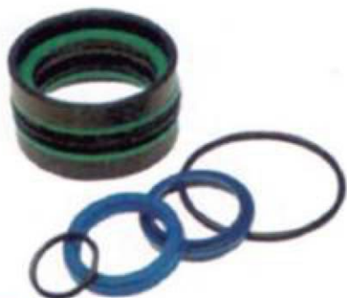
Kit de juntas para pistones