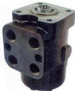
Hidrogúa con válvula incorporada