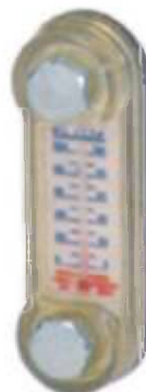
Indicador de nivel