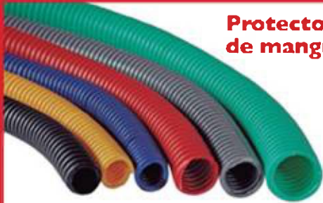
Protectores de mangueras