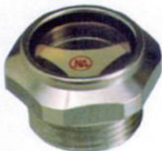
Tapón indicador de nivel de aluminio