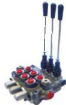
Distribuidor hidráulico (3 palancas)