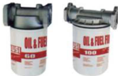
Filtros diesel y aceite