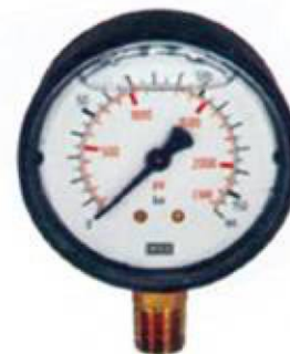
Manómetro de glicerina